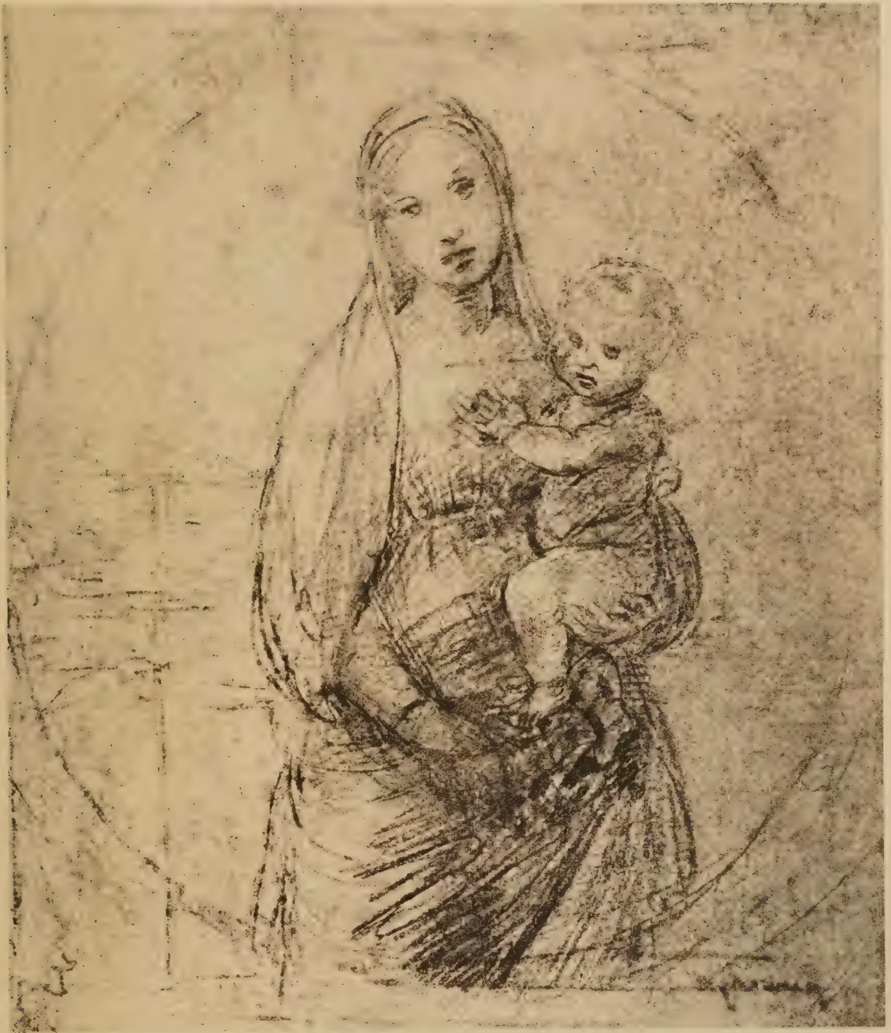
Esquisse pour la Vierge du Grand Duc